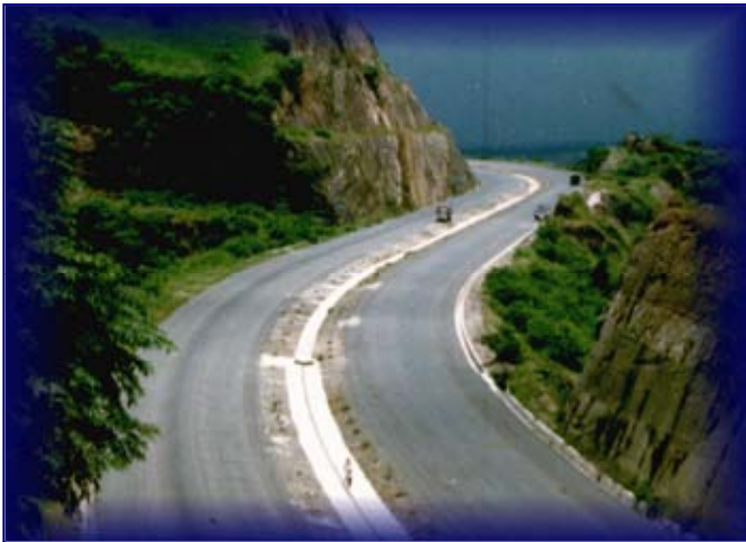
Carretera San Salvador - San Miguel, El Salvador.

La empresa desarrolla sus servicios de asesoría, diseño, supervisión y control de calidad con medios propios en todas las fases, desde las actividades de campo, laboratorio y trabajos de gabinete, hasta la elaboración y entrega de documentos de proyecto (planos, especificaciones, presupuestos, instructivos, manuales, etc.).