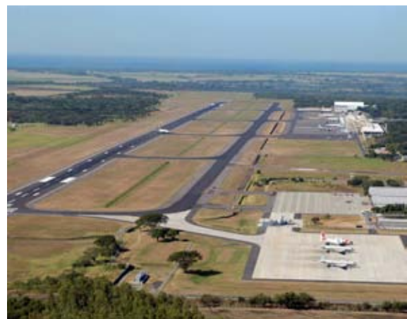
Aeropuerto Internacional El Salvador.