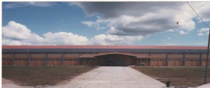
Zona Franca Las Mercedes, Managua