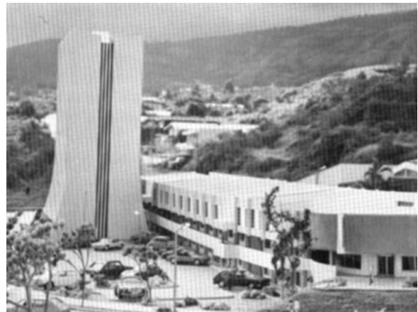
Condominio "Balam-Quitze", El Salvador.