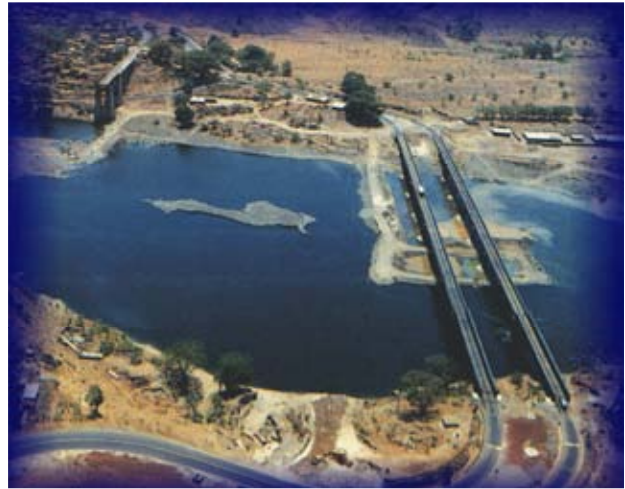
Río Lempa, El Salvador.

Mauricio A. Lara y Asociados es una firma salvadoreña activa desde 1963 en diseño, consultoría y supervisión de proyectos de ingeniería y arquitectura en el ámbito nacional e internacional. Nuestra experiencia abarca una amplia gama de proyectos, desde rehabilitaciones, readecuaciones y reconstrucciones hasta construcciones nuevas, cubriendo una amplia variedad de tipos de obra.