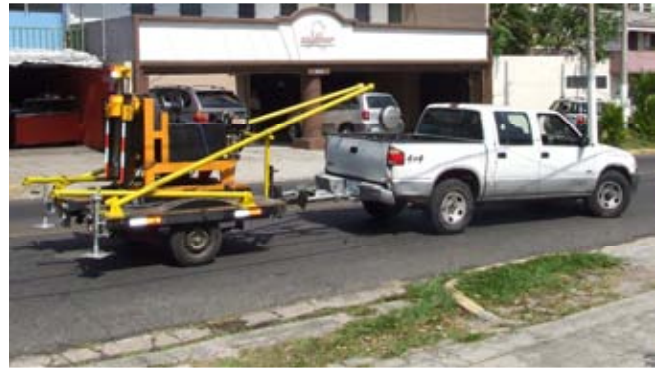
Equipos de Sondeo Geotécnico