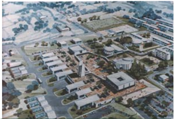
Centro Nacional de Tecnología Agropecuaria, El Salvador.