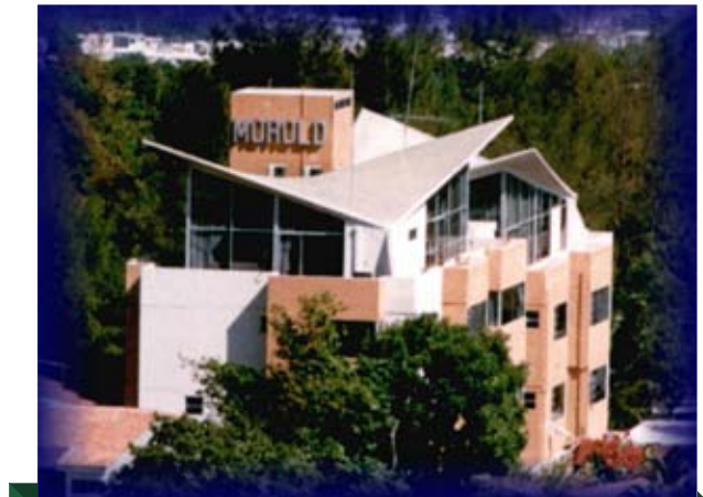
Edificio OIRSA, El Salvador.